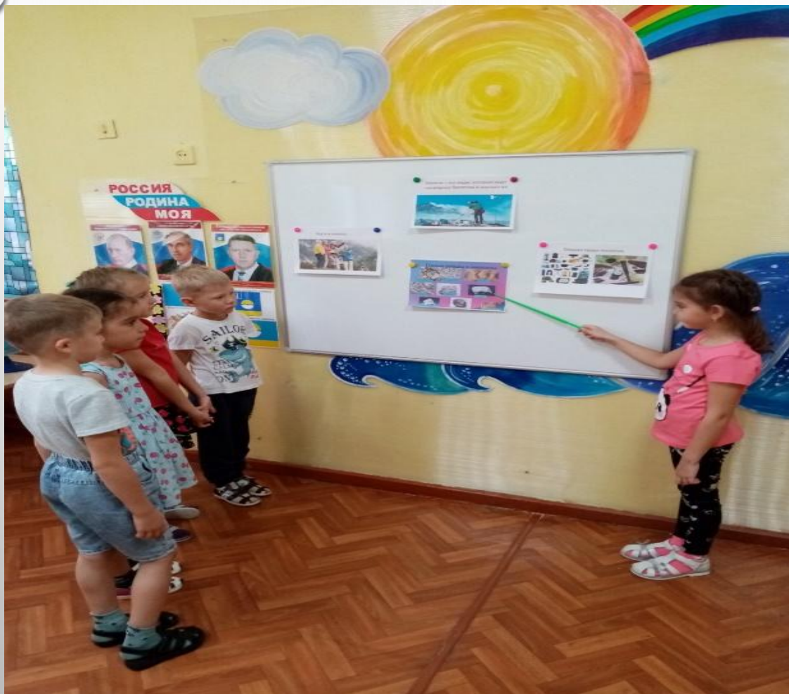
Что мы знаем о граните и мраморе

Цель: развивать и закреплять знания детей о полезных ископаемых: граните и мраморе. Продолжить знакомство с их свойствами и особенностями в процессе экспериментирования