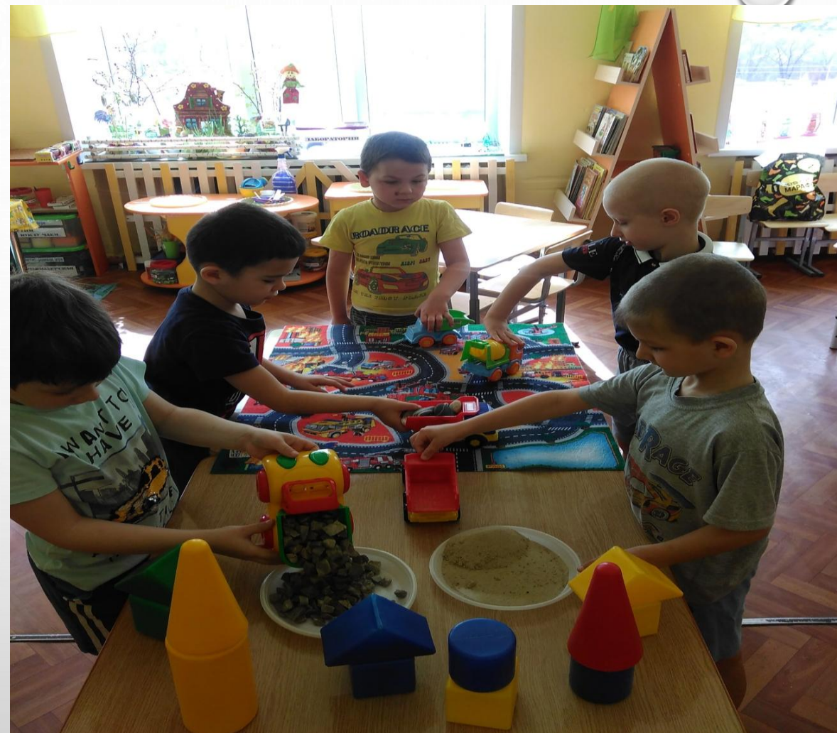
Игра: «Перевозка щебня и песка»