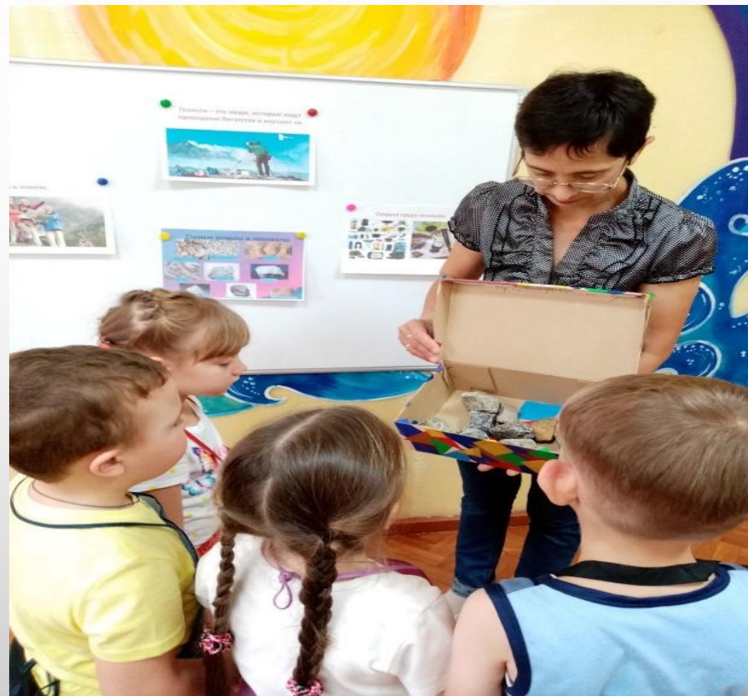
Наша коллекция гранита и мрамора